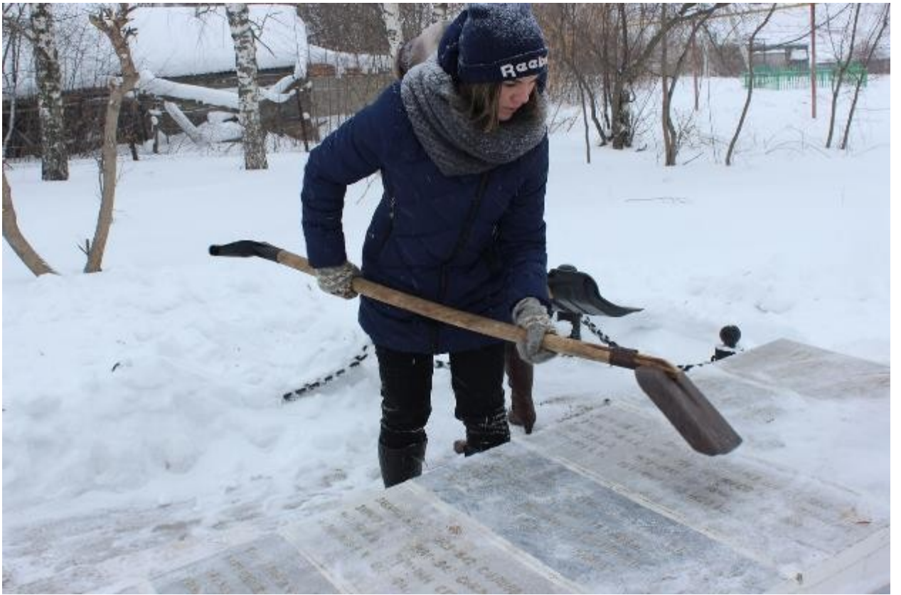
Приведение в порядок территории братского захоронения