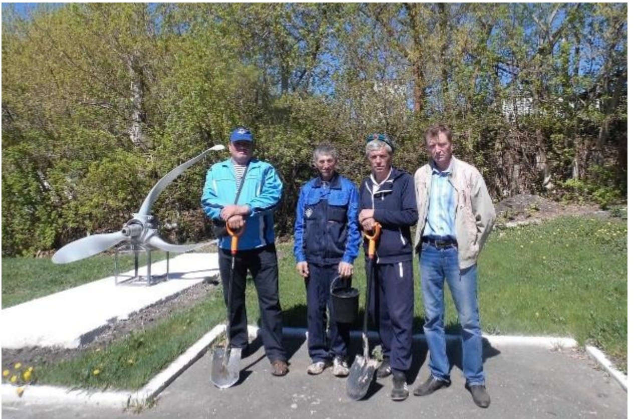
Приложение № 2