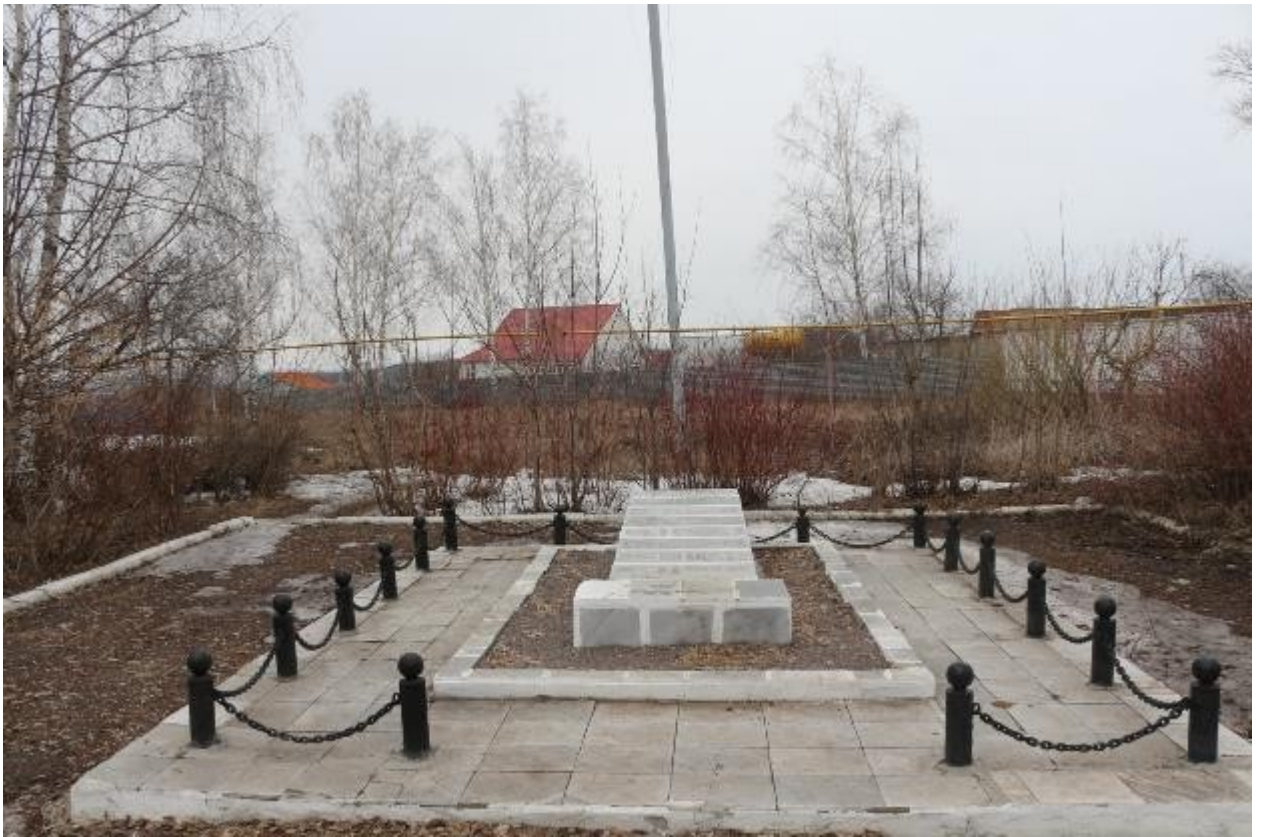
Братская могила в Каменке.